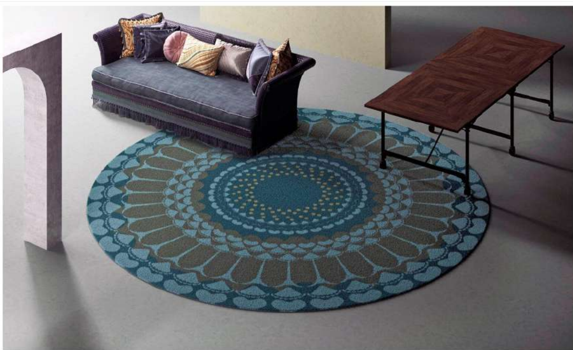
Ένα από τα χαλιά της συλλογής που δημιούργησε η Μαριάννα Πέγκα για τους Yo2 Designs www.yo2.io

Χαλιά, wallpapers, λευκά είδη, μαξιλαράκια, mugs... Χρώματα, μοτίβα... Με ποια σειρά δημιουργείς; Πρώτα στο χαρτί με μολύβι και στη συνέχεια μεταφέρεις το design σου σε ψηφιακή μορφή στον υπολογιστή; Συνήθως αρχίζω να δουλεύω πάνω στο χαρτί, πειραματίζομαι με τη σύνθεση και τη φόρμα, καθώς ανακατεύω χρώματα και πειραματίζομαι με υλικά. Μετά τα μεταφράζω σε ψηφιακή μορφή και επιλέγω τα υφάσματα που μου αρέσουν. Όταν επεξεργάζομαι υφάσματα ή χρησιμοποιώ μαλλί για πλεκτά, το σχέδιο είναι καθαρά χειροποίητο από την αρχή μέχρι το τέλος.