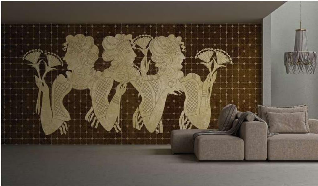
Άλλη μια ταπετσαρία που δημιούργησε η Μαριάννα Πέγκα για τους Yo2 Designs www.yo2.io

Χαλιά, wallpapers, λευκά είδη, μαξιλαράκια, mugs... Χρώματα, μοτίβα... Με ποια σειρά δημιουργείς; Πρώτα στο χαρτί με μολύβι και στη συνέχεια μεταφέρεις το design σου σε ψηφιακή μορφή στον υπολογιστή; Συνήθως αρχίζω να δουλεύω πάνω στο χαρτί, πειραματίζομαι με τη σύνθεση και τη φόρμα, καθώς ανακατεύω χρώματα και πειραματίζομαι με υλικά. Μετά τα μεταφράζω σε ψηφιακή μορφή και επιλέγω τα υφάσματα που μου αρέσουν. Όταν επεξεργάζομαι υφάσματα ή χρησιμοποιώ μαλλί για πλεκτά, το σχέδιο είναι καθαρά χειροποίητο από την αρχή μέχρι το τέλος.