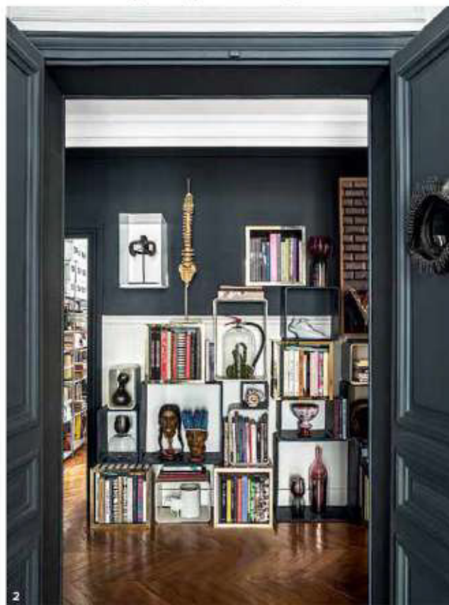
1. Холл. Дизайн хозяйки дома: обои для YO2 Design на ширме Créations Mourra, ваза Minotaures для Vista Alegre. Печь XIX века, стул Маартена Бааса. 2. Стеллаж, Вилли Гуль, 1970-е. Среди экспонатов целозвеческий позвоночник, подарок Кристиана Лакруа; голова индейца Амазонки, XIX век; керамика Пикассо, братьев Клотье, Франсуазы Рами. 3. Столики Space Island Саша Валькофф создал для Edition van Treeck. Металл, шелкография на стекле. 1. In the hallway, Sacha Walckhoff design: wallpaper for YO2 Design on Créations Mourra screen, Minotaures vase for Vista Alegre. 19th century burner, chair by Maarten Baas. 2. Bookcase by Willy Gulh from the 70s. On the shelves, human spiral column, gift from Christian Lacroix; head of Amazonian Indians, 19th century; ceramics by Pablo Picasso, Cloutier brothers, Françoise Ramie. 3. "Space Island" coffee tables in metal and serigraphed glass by Sacha Walckhoff for Edition van Treeck.