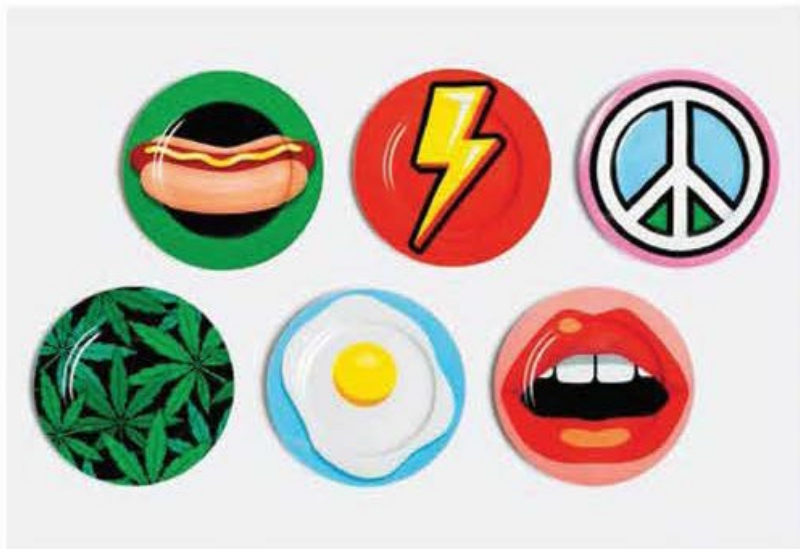
图 Pictures / 尼克·泰纳格尔 Nynke Tynagel, Yo2, 碧莎 Bisazza、摩伊 Moooi, NLXL, Seletti

以夸张著称的荷兰设计工作室Studio Job成立已超过20年。作为该工作室的合伙人之一，相较于戏精的“另一半”，尼克·泰纳格尔(Nynke Tynagel)显得低调，甚至高冷。尼克的平面设计师角色，却让Studio Job突破设计的边界。Bisazza的瓷砖、Moooi的家具、NLXL的墙纸还有Seletti的餐具等，这些充满辨识度的人气产品都