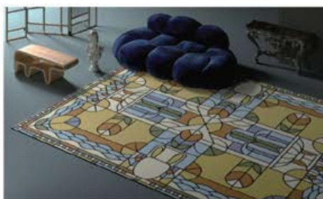
GLOOMY 地毯 (YO2)